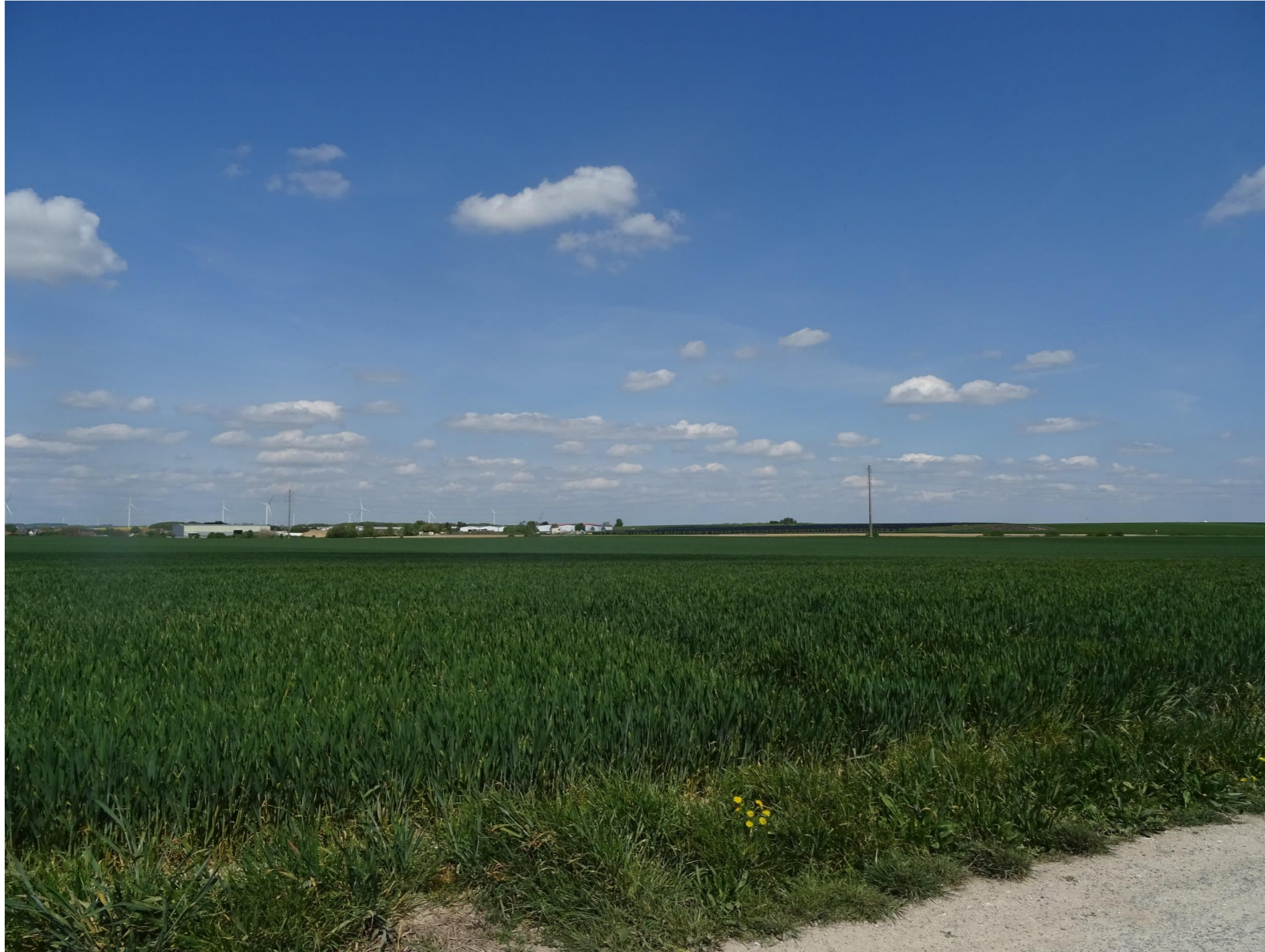
POINT DE VUE 3 : depuis le sud-Est